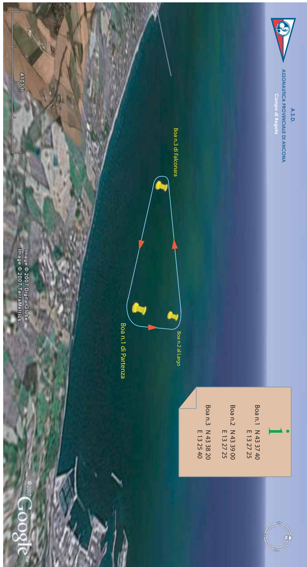
Esempi di partenza con venti provenienti dal 1° e 2° quadrante: boa di disimpegno lasciata a sinistra