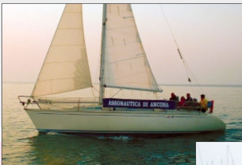
Sopra: arcipelago delle Kornati, Croazia. A sinistra: un'immagine della crociera del Nautico.

Zara e Sebenico. Si è trattato di una "full immersion" nella navigazione d'alto mare, con tutti i suoi aspetti pratici e strumentali, ed anche di una bella esperienza di vita a bordo. Con questa iniziativa si apre la nostra collaborazione con l'Istituto Nautico, che crediamo possa estendersi ed arricchirsi con nuove idee.