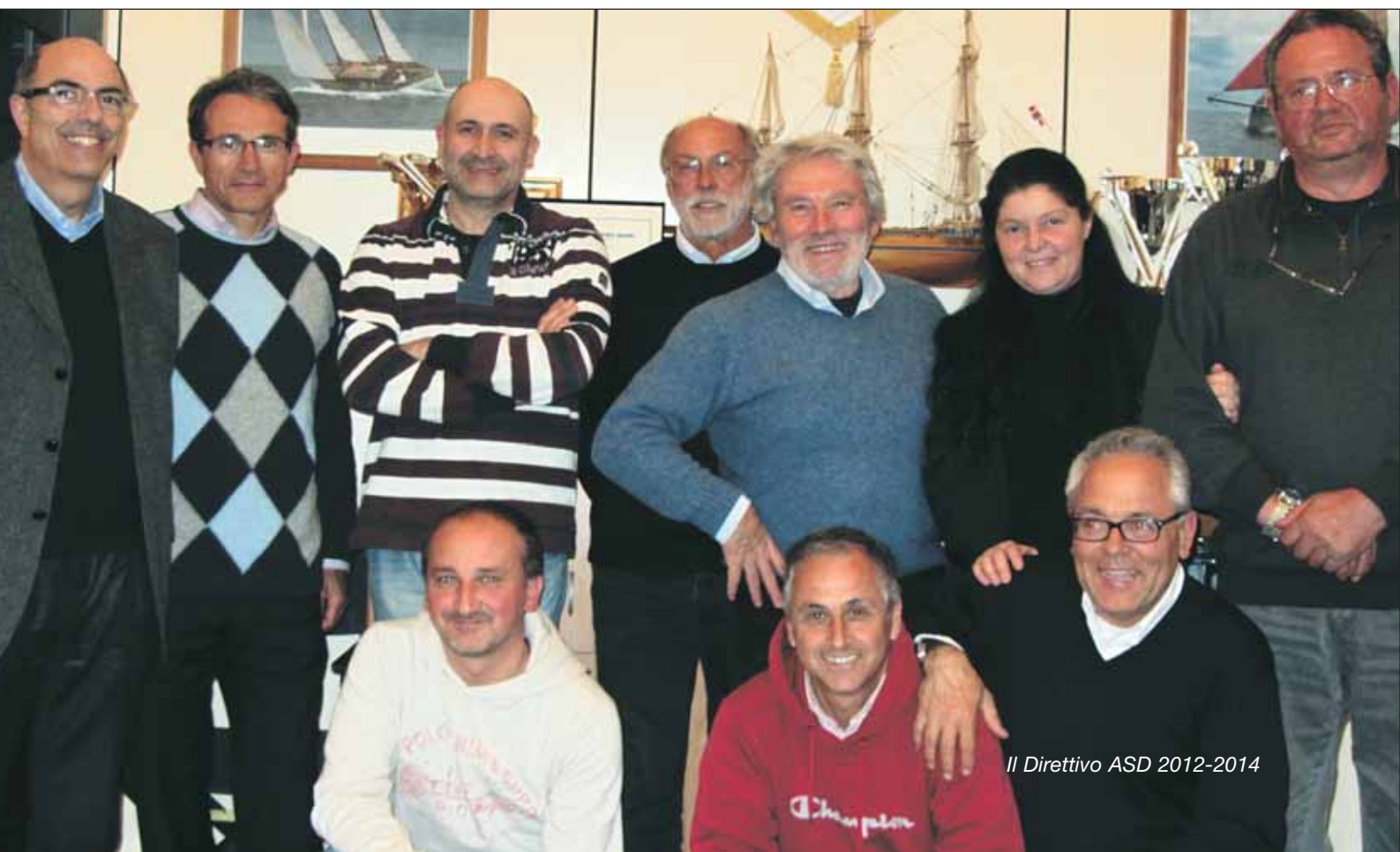
Il Direttivo ASD 2012-2014