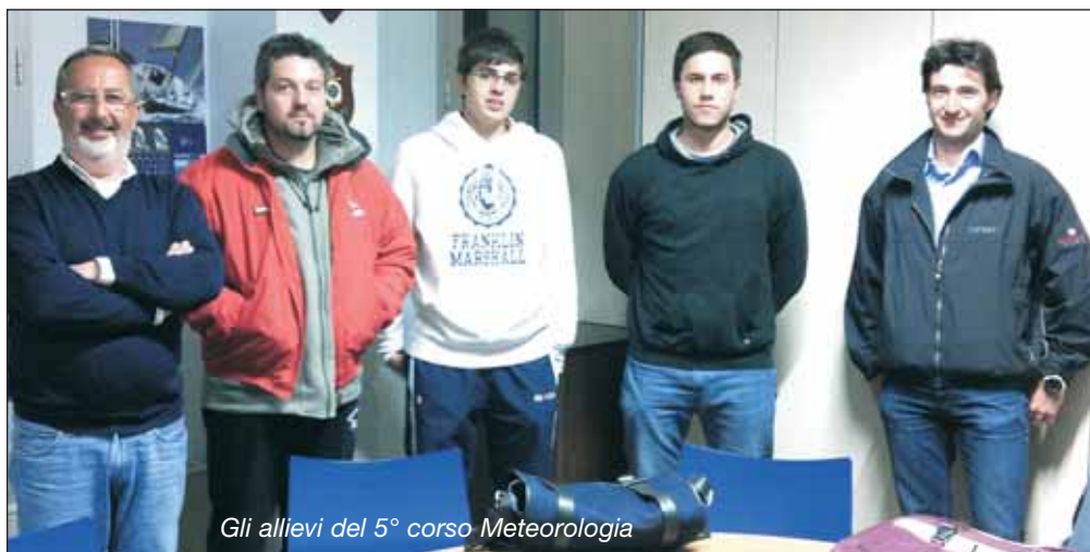
Gli allievi del 5° corso Meteorologia

Con i recenti cambiamenti climatici, la meteorologia diviene a pieno titolo un'arte Marinaresca che non è tanto differente delle varie arti da conoscere di chi va per mare in modo consapevole e in sicurezza. E' iniziato con cinque allievi tutti neofiti il 19 di marzo 2012 il 5° corso di Meteorologia indetto dall'Assonautica di Ancona, sessione primaverile. Le motivazioni a frequentare il corso degli allievi sono differenti, chi è attratto dagli strumenti e ne vuole conoscere l'impiego, chi invece vuole approfondire maggiormente le conoscenze teoriche e pratiche ad ogni costo, chi vi partecipa ignaro delle potenzialità che conseguirà. Le lezioni in aula sono scandite da ritmi di due ore ciascuna, dove ai momenti di teoria seguono quelli delle esercitazioni pratiche. Ogni allievo si confronta nella pratica con quello che ha appreso, e viene sostenuto costantemente dal docente in modo individuale fino al completo apprendimento. All'inizio la materia sembra nebulosa, vasta e difficile, ma è normale che sia così. Con la terza o meglio quarta lezione si inizia ad intravedere la padronanza della materia dai primi successi durante le esercitazioni pratiche. La