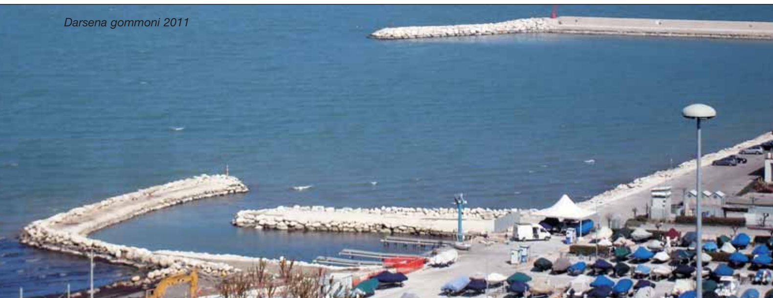
Darsena gommoni 2011

dentro il porto. I lavori inizieranno al più presto e i titolari di posto saranno tenuti aggiornati. Dovrà cambiare di conseguenza anche la viabilità della zona e, tra gli altri effetti della decisione, le barche attualmente ormeggiate nella zona dei futuri scivoli saranno sistemate sui pontili Sud, e le tariffe dei posti a terra dovranno essere riviste, sia per coprire i costi dell'operazione, sia perché il servizio avrà un livello molto più elevato. Tutti infatti sono d'accordo nell'applicare il principio che i costi dell'area delle barche a terra debbano essere "ribaltati" sugli utenti dello stesso servizio, e non sugli altri utenti.