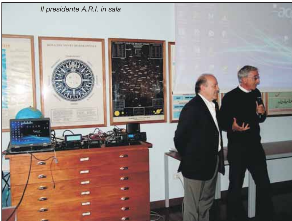
Il presidente A.R.I. in sala

pre usato esclusivamente una piccola barca con un fuoribordo da 4 hp. presa a noleggio sul posto!! Se volete vedere queste sue attività andate su : http://www.gianfrancogervasi.it/ioca.htm mentre il sito dell’A.R.I. di Ancona, dove potrete desumere ulteriori informazioni e notizie sui Radioamatori, risponde alla pagina: http://www.ariancona.it/ . A conclusione dell’interessante giornata è seguito un aperitivo e l’omaggio da parte degli amici radioamatori dell’A.R.I. di Ancona delle cartoline che hanno prodotto a ricordo dell’evento.